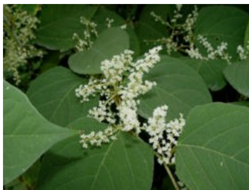
Les feuilles et les fleurs

L'APTIV est à votre disposition pour donner des conseils (il faut désherber et brûler).