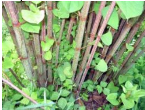
Les tiges peuvent atteindre 2 à 3m

Introduite en Europe comme plante ornementale des jardins, les renouées du Japon se sont répandus sur les terrains remaniés, le long des axes routiers et des voies ferrés et surtout le long des cours d'eau posant de graves problèmes écologiques. C'est une plante invasive très néfaste pour la biodiversité.